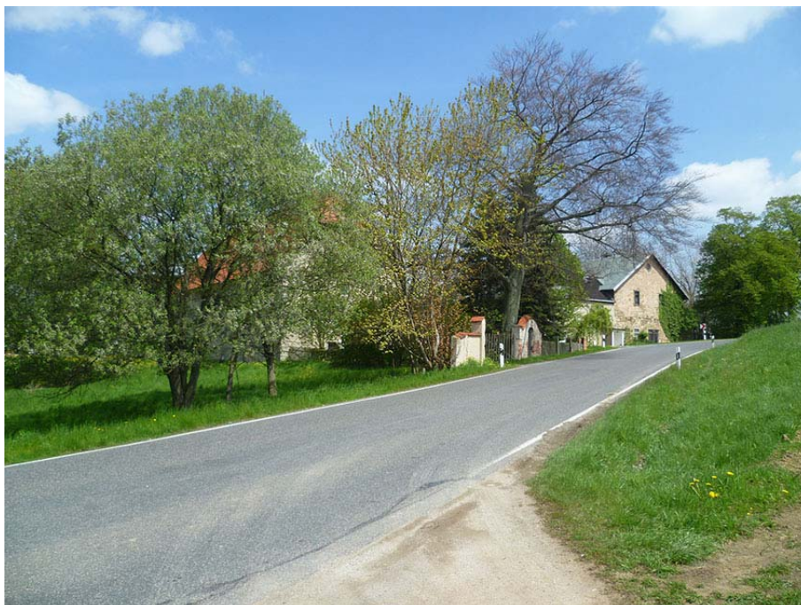
Kreischaer Straße Richtung Norden mit benachbartem ehem. Gehöft Nr. 25