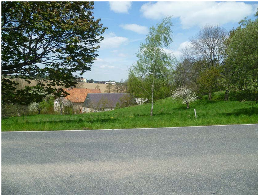
Blick auf das Flurstück von der Kreischaer Straße aus